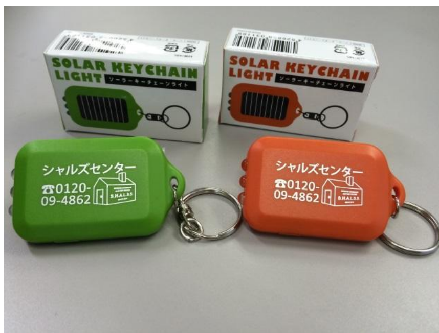
ソーラーキーチェーンライト