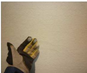
触ると白い粉がつく