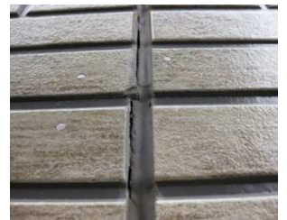
目地がヒビ割れている