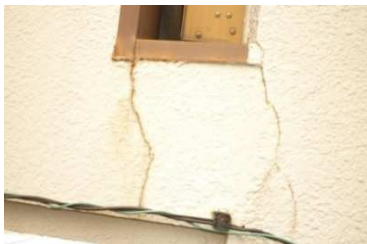
外壁にヒビが入っている