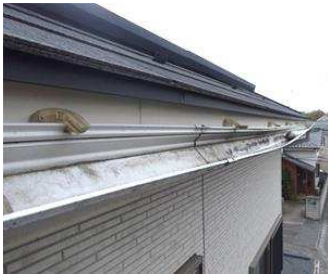
大雪による雨樋の破損