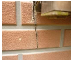
外壁にヒビが入っている